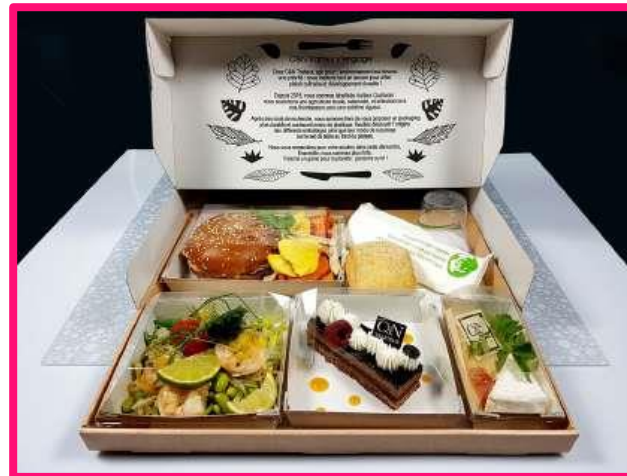
Présentation des Gourmets Occitan, Végé, Eco, Chaud et Voyage